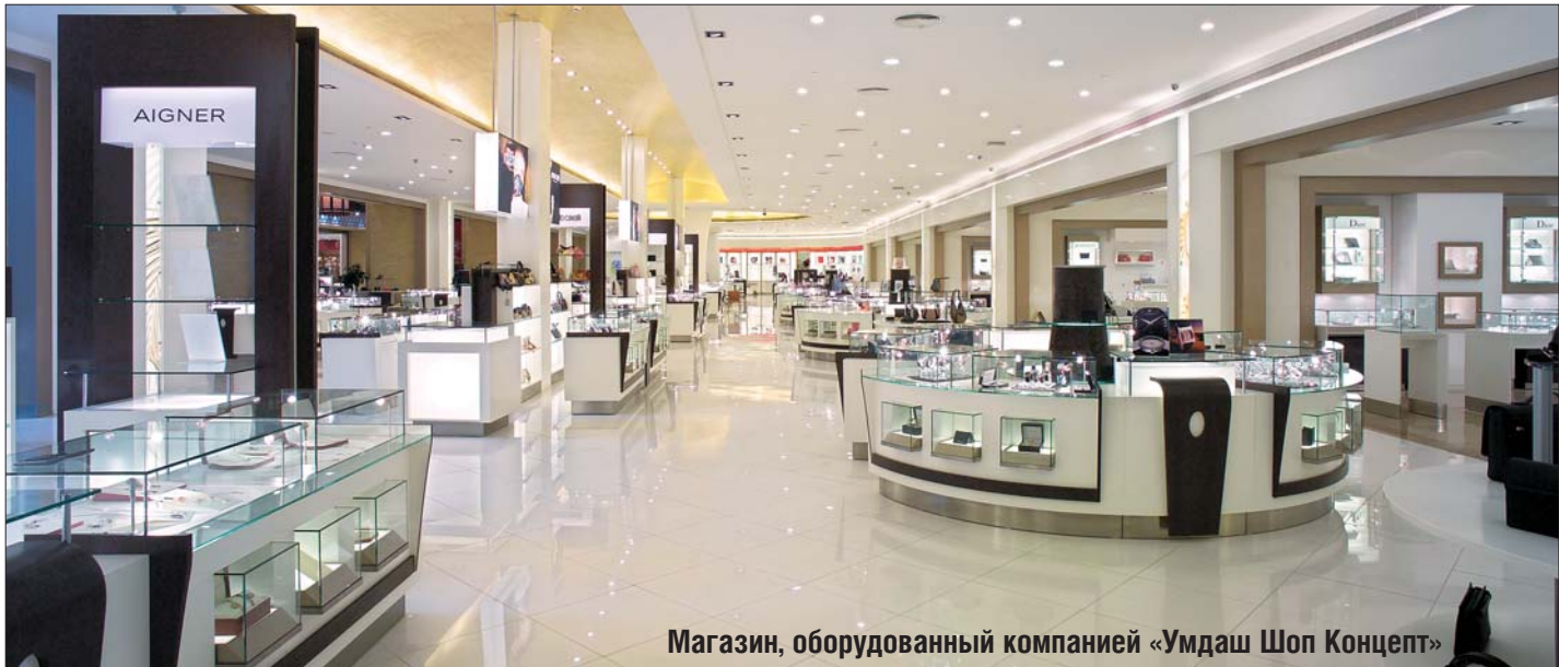
Магазин, оборудованный компанией «Умдаш Шоп Концепт»

От правильного выбора оборудования – в частности, торговой мебели – для бутика, салона или магазина во многом зависит общий успех ювелирного бизнеса. Правильный выбор видов и моделей мебели, цвета и качества её декоративных покрытий, продуманное расположения витрин, прилавков, ниш, фокус-групп даёт огромный плюс магазину. Ведь умело выполненные «декорации» создают необходимую гармонию между красотой и пользой, стильностью и удобством, атмосферой праздника и уютом. Именно мебель помогает решить проблемы качественного и эффективного использования пространства места в торговом зале.