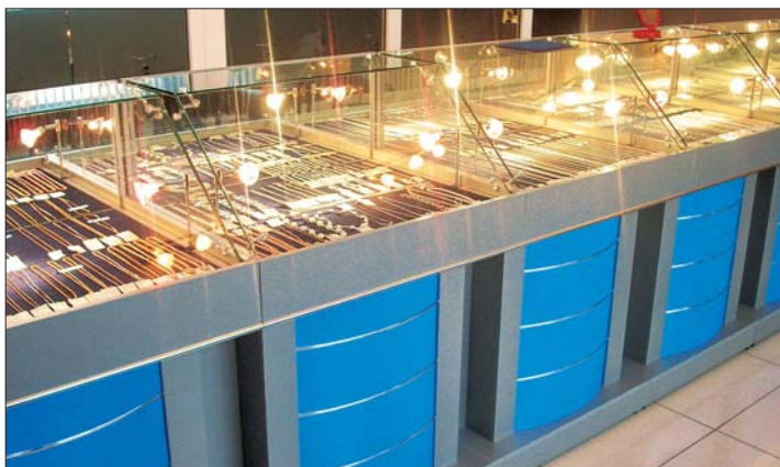
Торговая мебель компании «Хромос»

Ежегодно модернизируя свою производственную базу в сочетании с творческим потенциалом дизайнеров, предприятию удалось достигнуть хороших результатов в изготовлении торговой мебели для ювелирных салонов. «Хромос» выполняет в краткие сроки заказы для клиентов, находящихся в любой точке России. Так, сегодня в число наших заказчиков входит большинство ювелирных фирм Казани.