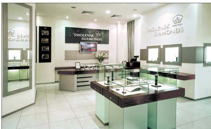
Торговая мебель компании «Red Line»