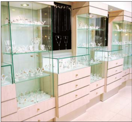
Торговая мебель компании «МДМ»

щении магазинов, и в том числе ювелирных. Дизайн-бюро МДМ оказывает полный комплекс услуг по созданию интерьеров магазинов и торгового оборудования. Отличительной чертой компании МДМ является наличие собственной высокотехнологичной производственной базы с парком новейшего итальянского, чешского и немецкого оборудования. Мы изготавливаем и продаём торговое оборудование, которое соответствует европейским стандартам качества и имеет привлекательный внешний вид. Для производства мебели используются совре-