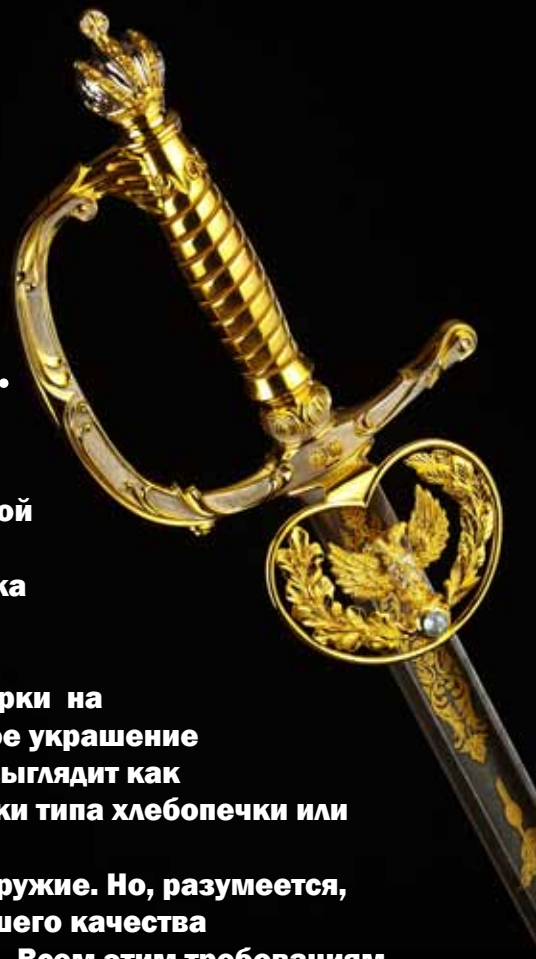
Шпага церемониальная «Высший Чин»

Оригинальная авторская идея и высочайшее профессиональное мастерство ювелиров предопределило создание истинного образца высокого ювелирного и оружейного искусства.