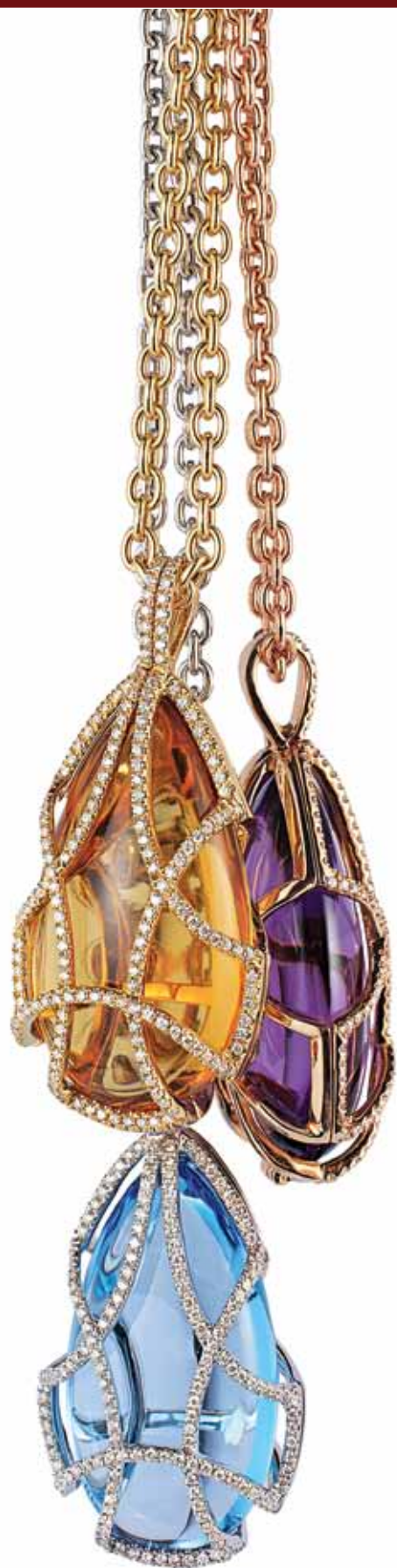
The Cage Collection by Goshwara

Учитывая опыт последних пяти месяцев, можно сказать, что в этом году будет популярен очень круп-