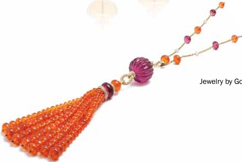
Jewelry by Goshwara